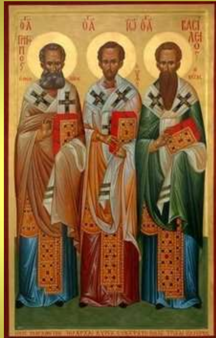
30 Ιανουαρίου Εορτή των Τριών Ιεραρχών

Και οι τρεις έδειξαν προσήλωση στη χριστιανική θρησκεία και η ζωή τους ήταν γεμάτη από αγώνες. Τα συγγράμματά τους έδωσαν αίγλη στη χριστιανική παιδεία.