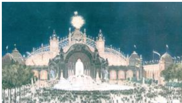
7 - Φωτισμός με ηλεκτρισμό