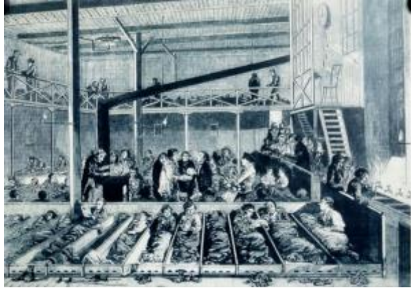
1 - Εργαζόμενοι σε εργοστάσιο