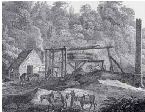
2 - Ανθρακωρυχείο του 1800 περίπου