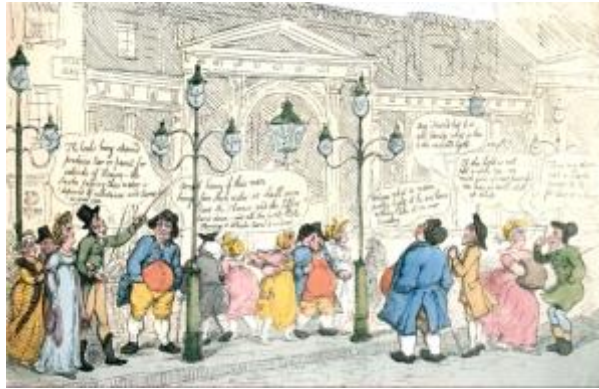
6 - Φωτισμός με φωταέριο