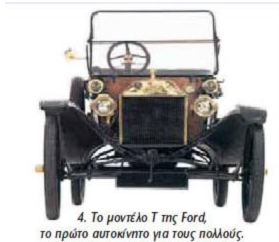
4. Το μοντέλο T της Ford, το πρώτο αυτοκίνητο για τους πολλούς.

8 - Το 1825 ο Άγγλος μηχανικός Στίβενσον κίνησε την πρώτη ατμάμαξα στη σιδηροδρομική γραμμή Λίβερπουλ-Μάντσεστερ.