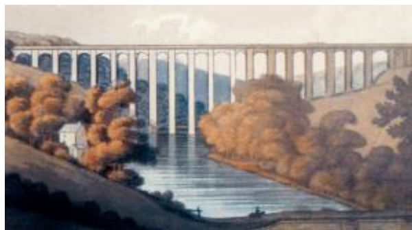
10 - Οι γέφυρες βοήθησαν τις συγκοινωνίες

9 - Το μοντέλο T της Ford, το πρώτο αυτοκίνητο για τους πολλούς