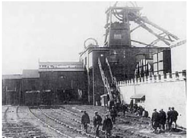
3 - Ανθρακωρυχείο του 1910 περίπου

Η. Οι κοινωνικές επιπτώσεις της εκβιομηχάνισης Οι κβλγμένεσ μετάνεσ του Αρκράϊτ (Άγγλοσ βιομηχανόσ) επαστύν λίγη βέρια, και μάλιστα μόνο παιδιά, με την επίβλεψη ενόσ επαστάτη. Ένα παιδί μπορεί να παρήκει τόσο όσα μεταλλασαν πολυπώτερο δέκα ενήλικεσ, κακά φορά και περισσότερο. Οι εκβιομηχάνεσ κλαστικέσ μετόνεσ, [...] επαστύν μόνο έναν εργαζόμενο για να τασ δουλέκει. Έπει, οι βλάπητα δέκα ενή, ο Ρίσαρντ Αρκράϊτ, ενόσ πώλυττοροσ βελώνεσ που εχε δεν εχε παρή τέτεσ κίρεσ όμωσ κι όμωσ, εχε επαστήσει παρκοσά που ζετηρενέ τασ οικοσ κλάδοσ κίρεσ. Την όια στήλη, εκαστονέτεσ γυναίκεσ όιασ υποκαρμίνεσ, ενήν, βίρελεσ, βίρελεσ δουλέκει, να εργαζόντε από το πρωί μέχρι το βράδυ, παρήγοντεσ πύρεσασ, ποσόντεσ βαμβακρούσ υφάσματεσ, για τέσικτεσ τέτετε πέντε πέντεσ (τέτεσ υποκαρμίνεσ τασ αγήλικεσ κίρεσ) την ημέρα, το παιδί. Ρίσαρντ Μόλερ. Μία ανασκεμνική παρρασάση τασ όμωσ των φημύων κλαστών (βαβλικόσ στο Lancashire (1786). Σημείωση: Όταν δεν αναφέρεται μεταφραστέσ, η μετάρφαση εχε μόνο από τους συγγραφέτεσ.